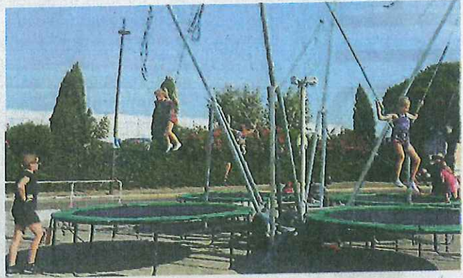
Du trampoline en animation au marché.

Une fois n'est pas coutume, ce dimanche, de nombreuses animations sont au programme à Lisle-sur-Tarn. Outre l'animation prévue à 17 h 30 au musée Raymond-Lafage, sur laquelle nous reviendrons dans l'édition de demain, la matinée sera bien chargée. Le marché et ses étals auront pris place de très bonne heure sur la place aux arcades avec de quoi ravir les yeux et les papilles. En effet, le marché lillois est devenu le lieu où faire ses courses avec toujours ce souci de trouver des produits « frais » auprès de producteurs locaux dans ce souci et cette démarche de circuits courts. L'association des forains lillois a toujours souhaité met-