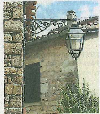
21 points lumineux ont été équipés.

Pour cette opération, le Syndicat Départemental d'Énergie du Tarn (Territoire d'Énergie Tarn) a participé à hauteur de 12 000 euros, soit environ 40 % du coût total des travaux hors taxes (matériel et frais de maîtrise d'œuvre compris). La contribution communale s'est élevée pour sa part à 20 742 euros pour la rénovation de l'éclairage public de Puycelsi.