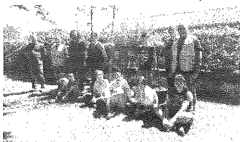
Neuf arbres plantés.

Spie CityNetwork, entreprise spécialisée dans le domaine de l'énergie et de la communications était engagée, lors de l'obtention du marché d'électrification rurale mis en place par le SDET, d'offrir aux communes un arbre à planter pour 150 mètres de tranchées réalisées. Aidé par les enfants