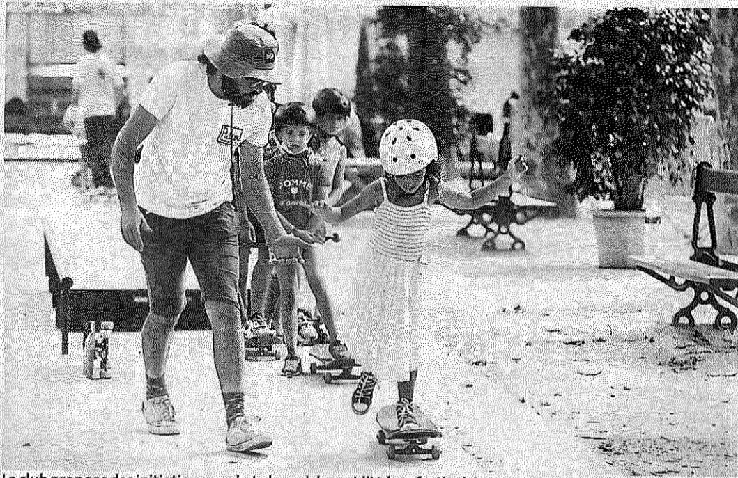
Le club propose des initiations au skate board durant l'Urban festival.